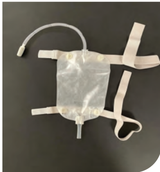
Taga i le vae