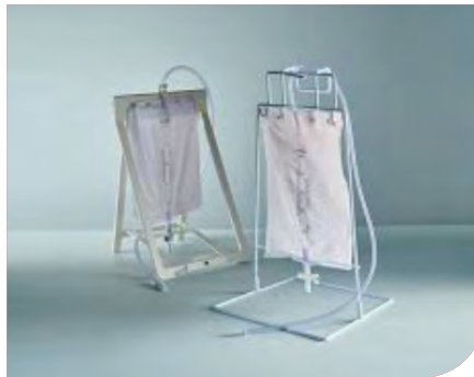
Taga o le po i le laulau

O le taga i le vae e fa'au'i atu i lau catheter ona faamau lea o le taga i lou vae. Ia mautinoa e faamau le taga mai tua o le vae, ina ia aua ne'i taofi ai le tafe o le feau vai. Ia mautinoa le maualalo ane le taga mai le tagamimi. E faasino atu e le alii/tamaitai tausima'i le auala e fai ai.